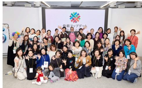
母親アップデートコミュニティ 5周年イベント (2024年1月開催)